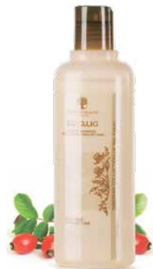
JEMNÝ ŠAMPÓN PRO BARVENÉ A SUCHÉ VLASY BAYALIG | SKVOST