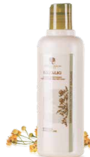
KONDICIONÉR PRO BARVENÉ A SUCHÉ VLASY BAYALIG | SKVOST