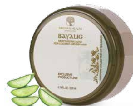
HYDRATAČNÍ MASKA PRO BARVENÉ A SUCHÉ VLASY BAYALIG | SKVOST

Díky aktivnímu složení, saturovanému extrakty bylin, se kořínky vlasů zpevňují, stimuluje se funkce vlasových folikulů. Plnohodnotná výživa napomáhá rychlému růstu lesklých, hladkých a pevných vlasů.