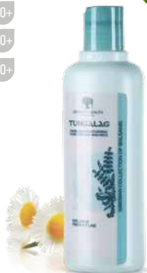
HYDRATAČNÍ TONIKUM TUNGALAG | SVĚŽEST

Zlepšuje dýchání buněk pokožky, aktivuje krevní mikrocirkulaci, zpevňuje drobné cévy, zneviditelnuje síť kapilár, sytí buňky kyslíkem a výživnými látkami, vyhlazuje drobné vrásky.