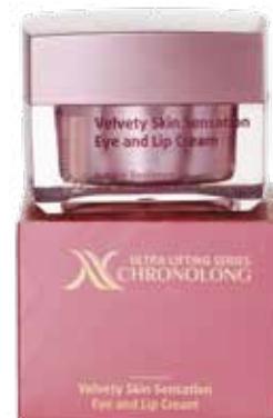
SAMETOVÝ KRÉM PRO PLEŤ OKOLÍ OČÍ A RTŮ CHRONOLONG

Zvláštní delikátní krém zpevňuje zralou pleť, chrání ji před vysoušením, zpomaluje procesy stárnutí. Jemná sametová textura krému vyplňuje drobné vrásky a nerovnosti, potlačuje hluboké vrásky. Úžasný efekt hladkého a sametového vzhledu pleti, který může být alternativou podkladové tónovací báze.