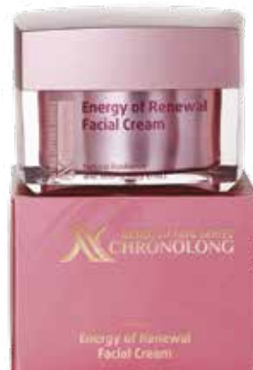
KRÉM NA OBLIČEJ «ENERGIE ZNOVUZROZENÍ» CHRONOLONG

Krém má zpevňující účinek a je vytvořen speciálně proti povisání pleti a s tím spojenými změnami obličejového oválu. Aktivní složky urychlují regenerační procesy pleti, vyživují ji a chrání před agresivním působením vnějšího prostředí. Pleť se stává pružnější, zpevňuje se, získává rovnoměrný odstín a mladistvý svit.