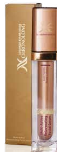
INTENZIVNÍ OMLAZUJÍCÍ SÉRUM NA OBLIČEJ CHRONOLONG

Vysoce účinné sérum cíleného působení aktivuje procesy regenerace pokožky, stimuluje syntézu kolagenu, což významně zlepšuje pevnost a pružnost pleti. Vrásky se stávají méně patrné, odstín pleti je rovnoměrnější a výsledkem je, že vypadáte mnohem mladistvěji.