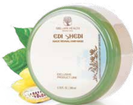
REGENERAČNÍ MASKA NA VLASY EDI SHEDI | MAGIE