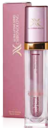
MODELAČNÍ SÉRUM PRO OBLIČEJ CHRONOLONG

Inovované sérum napomáhá obnově pružnosti pleti, zpevňuje ji a vypíná. Komplex aktivních složek zbavuje pleť ochablosti, sytí ji biologicky aktivními látkami, potlačuje změny obličejového oválu, způsobené gravitací. Hluboké vrásky se vyhlazují, pleť získává svěží vzhled.