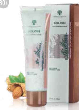
REGENERAČNÍ PEELING NA OBLIČEJ S ČÁSTEČKAMI MANDLÍ DOLGIN | VLNA

Napomáhá odstranění zrohovatělých buněk pokožky a hloubkově čistí pleť, vyhlazuje drobné nedokonalosti. Otevírá ucpané póry, zlepšuje krevní mikrocirkulaci, napomáhá vyloučení škodlivin a toxinů, zlepšuje dýchání buněk.