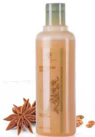
REGENERAČNÍ ŠAMPÓN EDI SHEDI | MAGIE