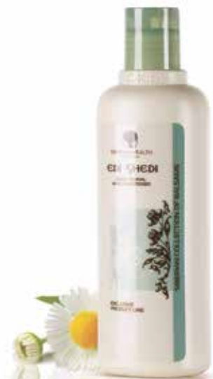
REGENERAČNÍ KONDICIONÉR NA VLASY EDI SHEDI | MAGIE