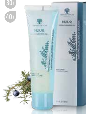
BYLINNÝ GEL NA MYTÍ NUUR | JEZERO

Pečlivě čistí pleť obličeje, jemně odstraňuje kosmetické přípravky, prach a nečistoty. Nevyvolává podráždění v případě, že zasáhne oči, změkčuje a zklidňuje pleť. Vhodný pro všechny typy pleti, zvláště pro pleť smíšenou.