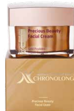
KRÉM NA OBLIČEJ «DRAHOCENNÁ KRÁSA» CHRONOLONG

Multiaktivní saturovaný krém s ceramidy daruje pleti podivuhodný pocit pohodlí, šetrně ji vyhlazuje a zpevňuje, činí ji pružnou. Inovovaná formulka potlačuje výrazné vrásky, má silný liftingový efekt a navrácí pleti měkkost a mladistvý vzhled.