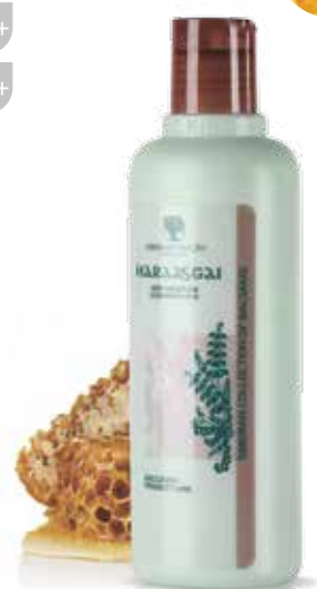
ČISTIČÍ MLEKO HARAASGAI | VLAŠTOVKA

Šetrně odstraňuje nečistoty, kosmetické přípravky a zbytky kožního mazu, přičemž zachovává ochrannou hydrolipidovou rovnováhu pleti. Odstraňuje zarudnutí pleti, obnovuje její energetický tonus. Je ideálním přípravkem pro normální a suchou pleť.