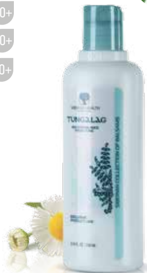
HARMONIZAČNÍ BALZÁM TUNGALAG | SVĚŽEST

Šetrně tonizuje pleť a normalizuje funkci mazových žlázek, zužuje póry, zlepšuje krevní mikrocirkulaci, zvyšuje tonus a tím i vnější vzhled pleti.