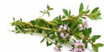
SIBIŘSKÁ MATEŘÍDOUŠKA Thymus serpyllum

Šípky jsou v celém světě proslulé, ale není všeobecně známo, že existuje množství druhů této rostliny. Sibiřské šípky neboli růže sibiřské se vyznačují neobvyklými, téměř černými větvičkami a tmavě rudými plody, což vytváří nádherný kontrastní efekt.