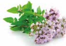
DOBROMYSL SIBIŘSKÁ Origanum vulgare

Plody kaliny jsou velice kyselé a jsou v mnoha zemích, kde se tato rostlina vyskytuje považovány za nejedlé. Protože potravinové zdroje Sibíře jsou velice omezené, místní obyvatelé se naučili zpracovávat i tyto bobule. Obvykle je používají jako nádivku tradičních sibiřských pirohů.