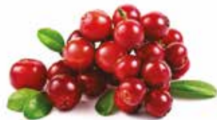
BRUSINKA Vaccinium vitisidaea

Šišák bajkalský je jedním z příkladů celosvětově oblíbené byliny, pocházející z oblasti Bajkalu. Tato bylina se odpradávná používá v čínské medicíně a díky jejím podivuhodně různorodým léčebným účinkům ji náležitě oceňují i lékaři ze západu.