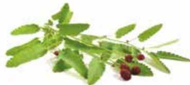
KRVAVEC TOTEN Sanguisorba officinale

Obsahuje až 10% přírodního křemíku, který se účastní tvorby vnitřního skeletu rostliny. Právě skelet a trubkovitý stvol činí přesličku jednou z nejdolnějších bylin.