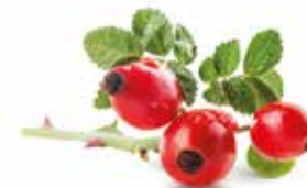
RŮŽE DAHURSKÁ (SIBIŘSKÝ ŠÍPEK) Rosa dahurica

Tato vysoká bylina s krvavě rudým květenstvím je exoticky vyhlížející ozdobou zelených sibiřských luk. Kvůli neobvykle zářivé barvě jejich květenství ji místní obyvatelé nazvali krvavcem – krev pijícím.