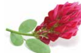
KOPYŠNÍK SIBIŘSKÝ Hedysarum sibiricum

Vždy s podzimem se v době prvních mrazků vydávaly ženy na blata sklízet klikvu, aby jí a jejími vitamíny zásobily na zimu své rodiny. Ledová voda, kterou se brodíly, jim mnohdy způsobovala vážná kloubní onemocnění. Pradávným prostředkem, který zbavuje takových neduhů je skromná bylina z močálů, známá jako altajský zábělník.