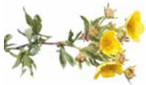
KURILSKÝ ČAJ Pentaphylloides fruticosus

Tato významná rostlina byla objevena námořníky na Kurilských ostrovech – připravovali si nápoj z jejich listků místo obvyklého čaje. Avšak v oblasti Bajkalu se tato bylina odedávna užívala jako přípravek pro očistu organismu. Legenda praví, že zjevení jejich užitečných vlastností lidem zprostředkovali jejich psi: nemocná zvířata hledala tuto rostlinu, aby jim ulevila v jejich trápení. Dosud k