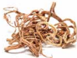
ZÁBĚLNÍK BAHENNÍ Comarum palustre

Jedná se o nenápadný keřík s bobulkami růžové až fialové barvy, který své pevně, lakované vypadající listky uchovává naživu po celou dlouhou sibiřskou zimu. Pod příkrovem několikametrové sněhové příkrývky dokáže přežít teploty -50°C i nižší.