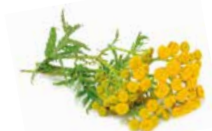
VRATIČ OBECNÝ Tanacetum vulgare

Kopyšník je horská bylina, tradičně rostoucí v Jižní Sibíři. Sibiřští lovci ji užívali jako podpůrný prostředek pro zlepšení fyzické kondice během dlouhodobých a vyčerpávajících loveckých výprav.