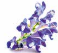
ŠIŠÁK BAJKALSKÝ Scutellaria baicalensis

Dobromysl, neboli oregáno je velice oblíbenou bylinou obyvatele Evropy a USA, na rozdíl od obyvatel Sibíře, ji velice často používají jako koření přípravků. Z dobromysle a tymiánu si Sibiřané zhotovují výrazně aromatický nápoj, který pijí místo běžného čaje. Hlavní přednost dobromysle sibiřské spočívá ve vysoké úrovni její antioxidantní aktivity – v tomto ohledu je přímo rekordmanem mezi všemi známými druhy této léčivky.