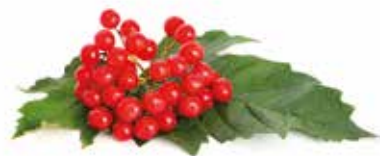
KALINA OBECNÁ Viburnum opulus

Tato významná rostlina byla objevena námořníky na Kurilských ostrovech – připravovali si nápoj z jejich listků místo obvyklého čaje. Avšak v oblasti Bajkalu se tato bylina odedávna užívala jako přípravek pro očistu organismu. Legenda praví, že zjevení jejich užitečných vlastností lidem zprostředkovali jejich psi: nemocná zvířata hledala tuto rostlinu, aby jim ulevila v jejich trápení. Dosud k